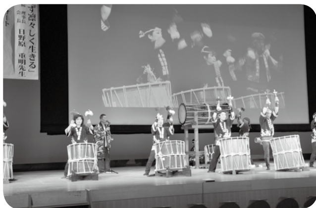
境港荒神神楽太鼓保存会による太鼓の演奏で熱く講演会のオープニングをスタートしました

日野原先生は聖路加国際病院 理事長として臨床医の傍ら、執筆や講演など国内外で精力的に活躍され、2000 年には「新老人運動」を提唱、「新老人の会」が全国で発足しました。講演会は日野原先生の百歳を記念して、「新老人の会」鳥取支部が主催、NPO 法人がいなネット、医療法人・社会福祉法人真誠会の共催で開催されました。講演会の前に境港幸神神楽太鼓保存会による勇壮な太鼓が披露されたほか、会場には米子市の福生東大凧同好会が「たちあがれ東北」と書かれた大凧を展示、場内は満席の約 1800 人の来場者で熱気に包まれました。