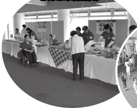
福祉の店おおぞらと もみの木作業所

福生東大凧同好会によるホ ワイエの連凧が、ステージの大 凧とともに、会場の雰囲気をも り上げていました