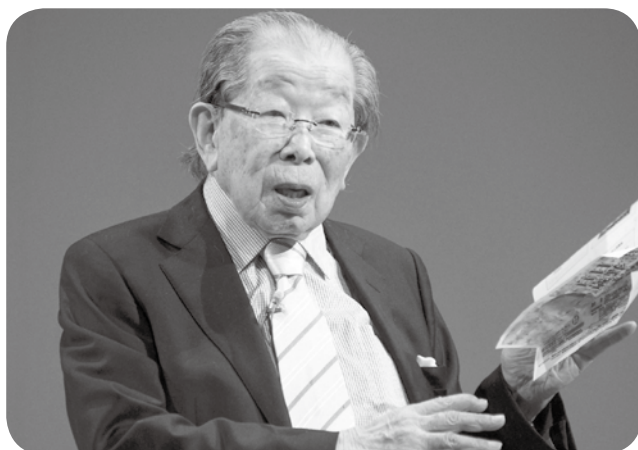
百歳を越えてもとてもパワフルな講演で元気の秘訣を語られました

百歳7カ月を迎える日野原先生は「逆風にめげず凛々(りり)しく生きる」と題して約1時間、立ったままで講演をされました。日野原先生は「逆風の中で勇気ある生き方とは、逆風に向かって前進するヨットの姿に似て、人は逆風の力を利用して目指す航路のゴールに達することができる」と指摘したうえで、「加齢によって得るものは、自分で使える時間が長くなり、自由人になれること。その時間を自分のためではなく、他人のために使うことが大切。今からでも遅くない。東北や世界で困っている人たちのために自分の時間を使い、エネルギーを持って前進しよう」と呼びかけ、医療法人・社会福祉法人真誠会より、日野原先生サイン入りの著書 200 冊が被災地の福島にプレゼントされました。