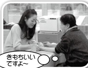
きもちいい ですよ～

来たる 6 月 17 日 (日) に「第 2 回地域公開講座」の開催を予定しています。次回は認知症の権威で全国的にも有名な鳥取大学医学部保健学科教授の浦上克哉先生をお招きし、認知症についてお話をさせていただきます。有意義な時間になること間違いなしですので、ぜひご参加くださいませ。