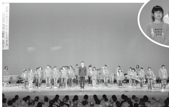
和田小学校の金管クラブの皆さん

コンサートの模様は光回線を使って福島会場にも届けられ、福島会場を訪れた約 100 人の皆さんと音楽を通して米子と福島の交流を深めました。