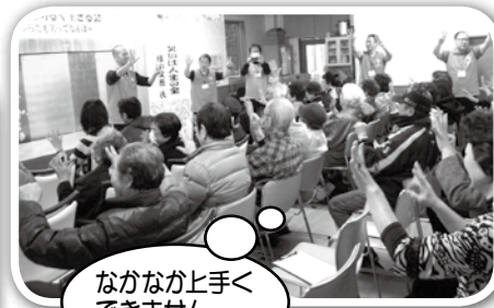
なかなか上手く できません・・・