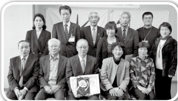
ふるさと大賞受賞、おめでとうございます!!

終始和やかに祝賀会は開催され、和田公民館ハーモニカ同好会伴奏による全員合唱「ふるさと」で御開きとなりました。