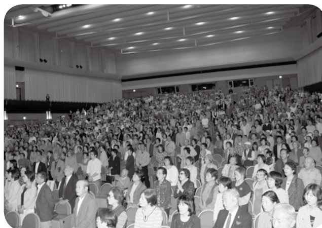
満席の会場では百歳の日野原先生のお話を聞き元気をもらいました