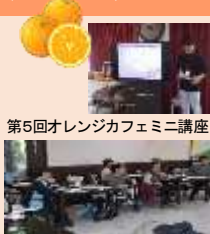
第5回オレンジカフェミニ講座

認知症・高齢者サポートとしてレジデンス1階にカフェを設置しています。お気軽にお越しくださいませ！また毎月1回さまざまなミニ講座も開催しています。