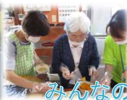
みんなの調理活動