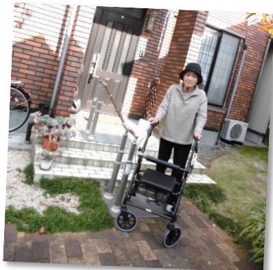
玄関から歩行器でGO!