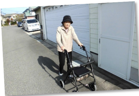
ご近所さんに挨拶しながら スーパーへ