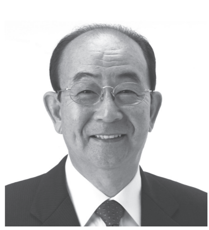
米子市長 野坂 康夫