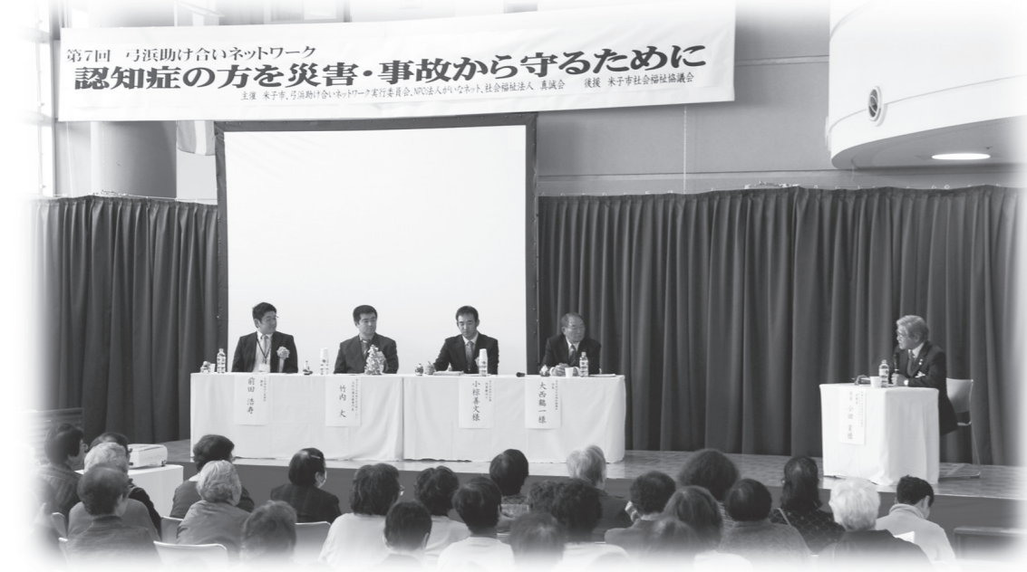
地域の支え合いについて話し合ったシンポジウム